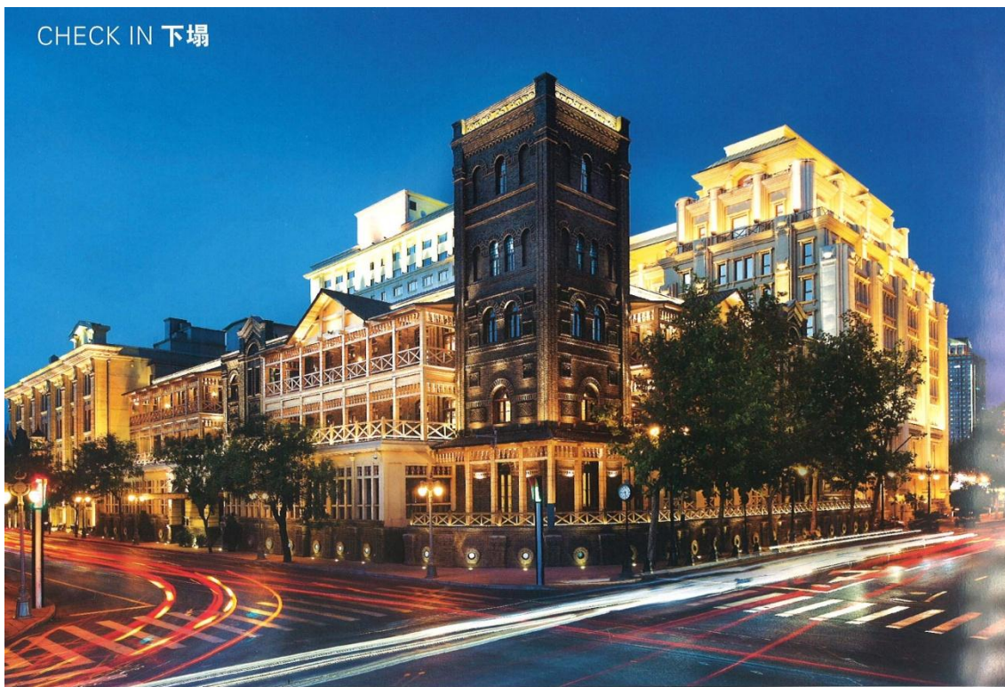
CHECK IN 下榻